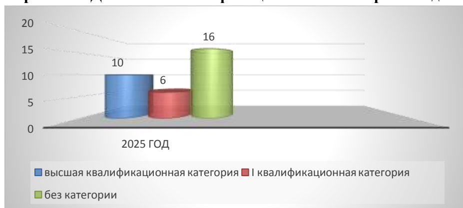
Диаграмма 1. Данные по квалификационным категориям педагогов

В МБДОУ детский сад №147 «Голубые дорожки» г. Брянска имеют высшую квалификационную категорию 10 педагогов, первую категорию – 6 педагогов, без категории – 16 педагогов (стаж работы 2 года и менее – молодые специалисты, а также с соответствием занимаемой должности).